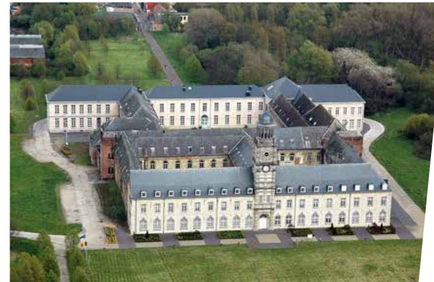
Abbaye Saint-Bernard de l'Escaut à Hemiksem.

La publication disponible sur le site du "National Trust" en Angleterre "Places that make us" montre à quel point les lieux significatifs contribuent au bonheur des individus et incitent au partage de ce bonheur avec autrui. Je suis convaincu qu'il s'agit là d'un instrument incroyable en réponse à la distanciation sociale et au manque de solidarité de nos sociétés. Malheureusement, les décisions sont encore souvent prises dans des salles obscures, ou l'accès est strictement limité et les communautés citoyennes exclues, ce qui crée frustration et insatisfaction.